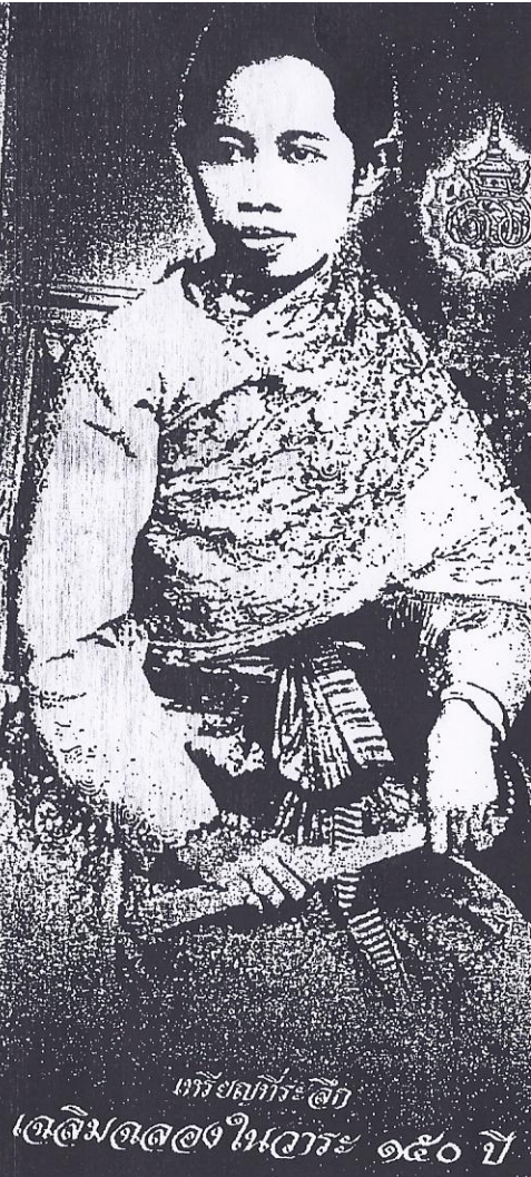
ทรงมีพระสิริ เฉลิมฉลองในวาระ ๑๕๐ ปี

โรงพยาบาลสมเด็จพระบรมราชเทวี ณ ศรีราชา ดังกต สภากาชาดไทย เป็นโรงพยาบาลที่สมเด็จพระพันวัสสาอัยยิกาเจ้า ทรงใช้พระราชทรัพย์ส่วนพระองค์สร้างพระราชนานแด่ สภากาชาดไทย ทั้งยังพระราชทานพระราชานุญาตโดยตลอด สมเด็จพระเทพรัตนราชสุดาฯ สยามบรมราชกุมารี ทรงพระปราชญ์ว่าควรจะมีกิจกรรมที่เอื้อประโยชน์แก่ประชาชน หนุ่มมากและเป็นสิ่งถาวรที่จะแสดงถึงพระมหากรุณาของ สมเด็จพระพันวัสสาอัยยิกาเจ้าให้เป็นที่ประจักษ์แก่มหาชน เป็นการเฉลิมพระเกียรติในวาระ ๑๕๐ ปี พระราชสมภพสมเด็จพระ พันวัสสาอัยยิกาเจ้า และเป็นกาลฉลองครบ ๑๐๐ ปี โรงพยาบาล สมเด็จพระบรมราชเทวี ณ ศรีราชา จึงทรงพระราชดำริว่าปัจจุบัน สถานที่ต่างๆ ในโรงพยาบาลสมเด็จพระบรมราชเทวี ณ ศรีราชา คับแคบ ไม่พอกับความต้องการ ควรสร้างอาคารเป็นศูนย์รักษา พยาบาลรวมจะเป็นประโยชน์แก่ชนหมู่มาก เพื่อสนองพระราชดำริ มูลนิธิฯ จึงจัดทำเหรียญพระรูปสมเด็จพระพันวัสสาอัยยิกาเจ้าเพื่อหา รายได้ เหรียญที่ระลึกนี้จำลองจากภาพหุ่นตัวมีมหาสดราจารย์ ศิลป์ พีระศรี รายได้ทั้งหมดจากการจำหน่าย ไม่หักค่าใช้จ่าย จะดูแลรักษา ถวายสมเด็จพระเทพรัตนราชสุดาฯ สยามบรมราชกุมารี เพื่อสมทบทุนโครงการก่อสร้าง "ศูนย์รักษาพยาบาลรวม เฉลิมพระเกียรติสมเด็จพระพันวัสสาอัยยิกาเจ้า ๑๕๐ ปี" ณ โรงพยาบาลสมเด็จพระบรมราชเทวี ณ ศรีราชา เพื่อเป็น ศูนย์กลางในการให้บริการทางการแพทย์ในภูมิภาคตะวันออกเฉียง ใต้เป็นการสืบสานและรักษาพระปณิธานของสมเด็จพระพันวัสสา อัยยิกาเจ้าไว้สืบต่อไป