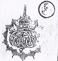
The Celebration of the 150th Anniversary of the Birth of Her Majesty Queen Saovabha Jarasravanon of Thailand